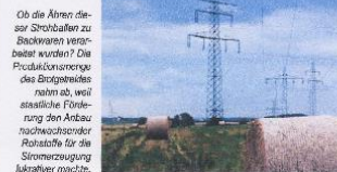
Ob die Stromerzeugung Stromerzeugung naturab, weil staatliche Förderung den Anbau nachwachsender Rohstoffe für die Stromerzeugung lukrativer macht.